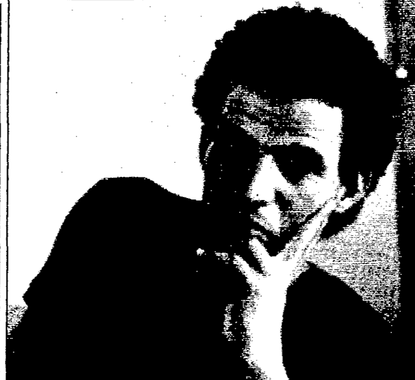
أولاد احمد (القدس العربي)